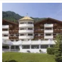
Ortisei: settimana del vino e dell'Alta