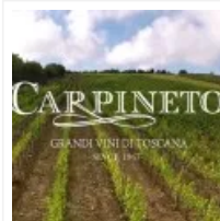
Carpineto, grandi vini di Toscana