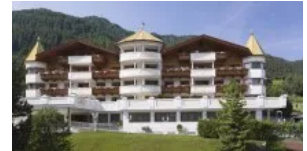
Ortisei: settimana del vino e dell'Alta cucina