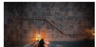
Pronti, partenza ... VYTA