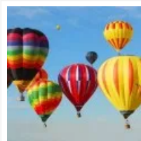
Paestum Balloon Festival