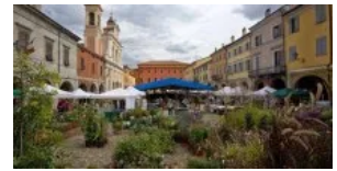
Piante e Animali Perduti sono a Guastalla