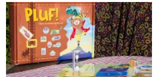
Pluf!, per conoscere le Valli del Monviso