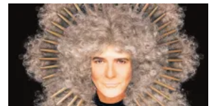
Zero il Folle in Tour