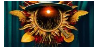
"D.O.C.": torna Zucchero