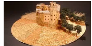
Montappone, "Paje: più di un grano"