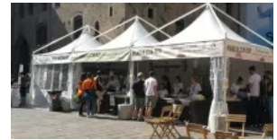
Bologna: Street food solidale